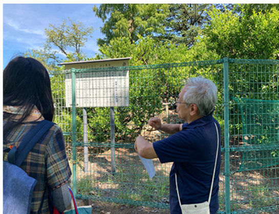
家康公銅像前、家康公お手植えのミカン前で、クイズを楽しんだ。