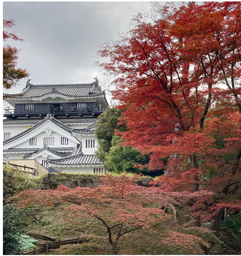
紅葉で彩られた岡崎城天守