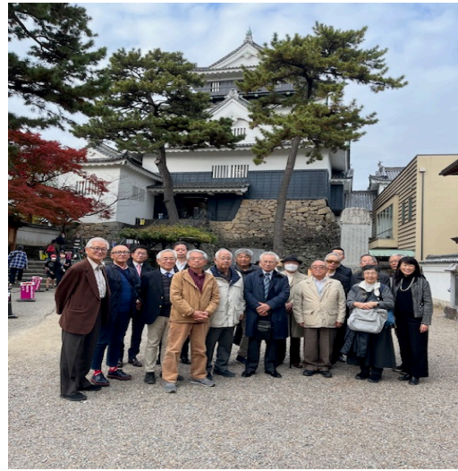
天守入口前で記念撮影