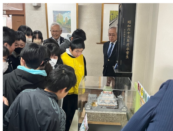
駿府城の模型を覗き込む6年生の皆さん