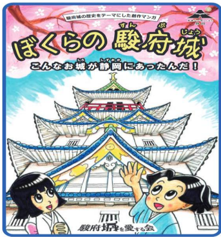
ロゴマークの使用 (p.1)