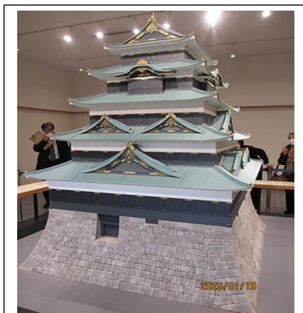
江戸城天守復元模型