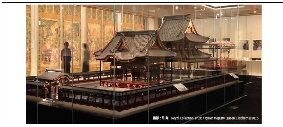
台徳院殿靈廟模型

内 容 駿府城天守復元模型の実現可能性を調査、研究するため、増上寺の「台徳院殿靈廟模型」、2020年9月に一般公開の皇居内本丸休憩所増築棟に設置された「江戸城天守復元模型」及び江戸城天守台等を視察した。