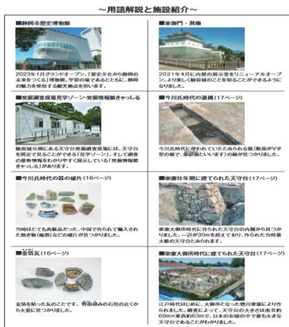
用語解説と施設紹介ページ (p.19)